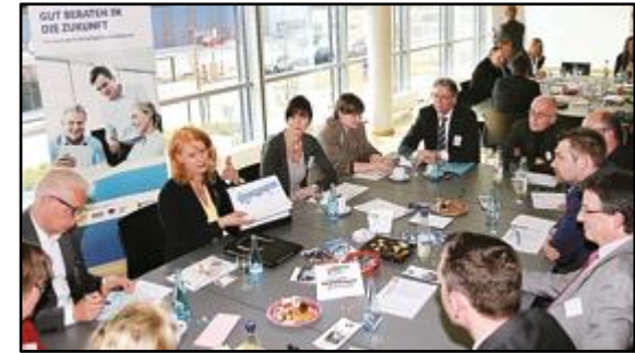
1. UnternehmensTalk 2016