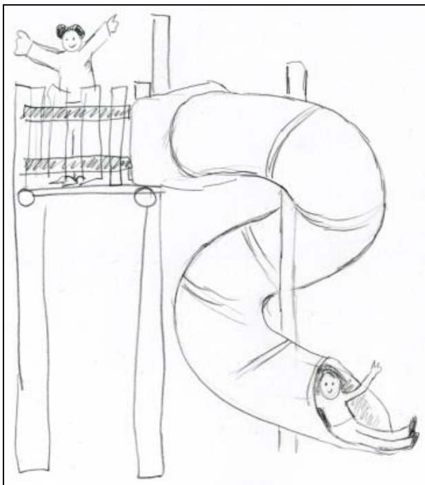
Eine Tunnelrutsche wird von fast allen favorisiert, sie hat 49 von 88 Punkten erhalten.