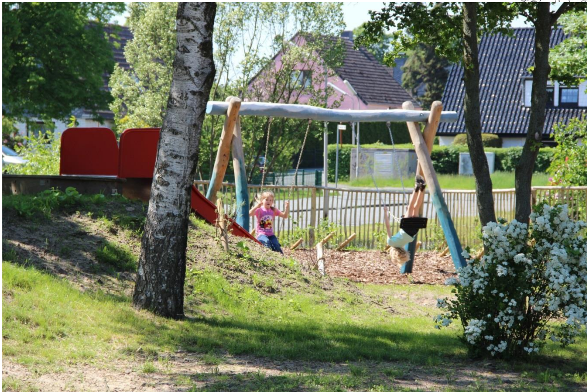
Schaukel aus Robinienholz ~3.600,- Euro