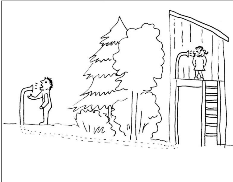
Das Sprechrohr bzw. Buschtelefon