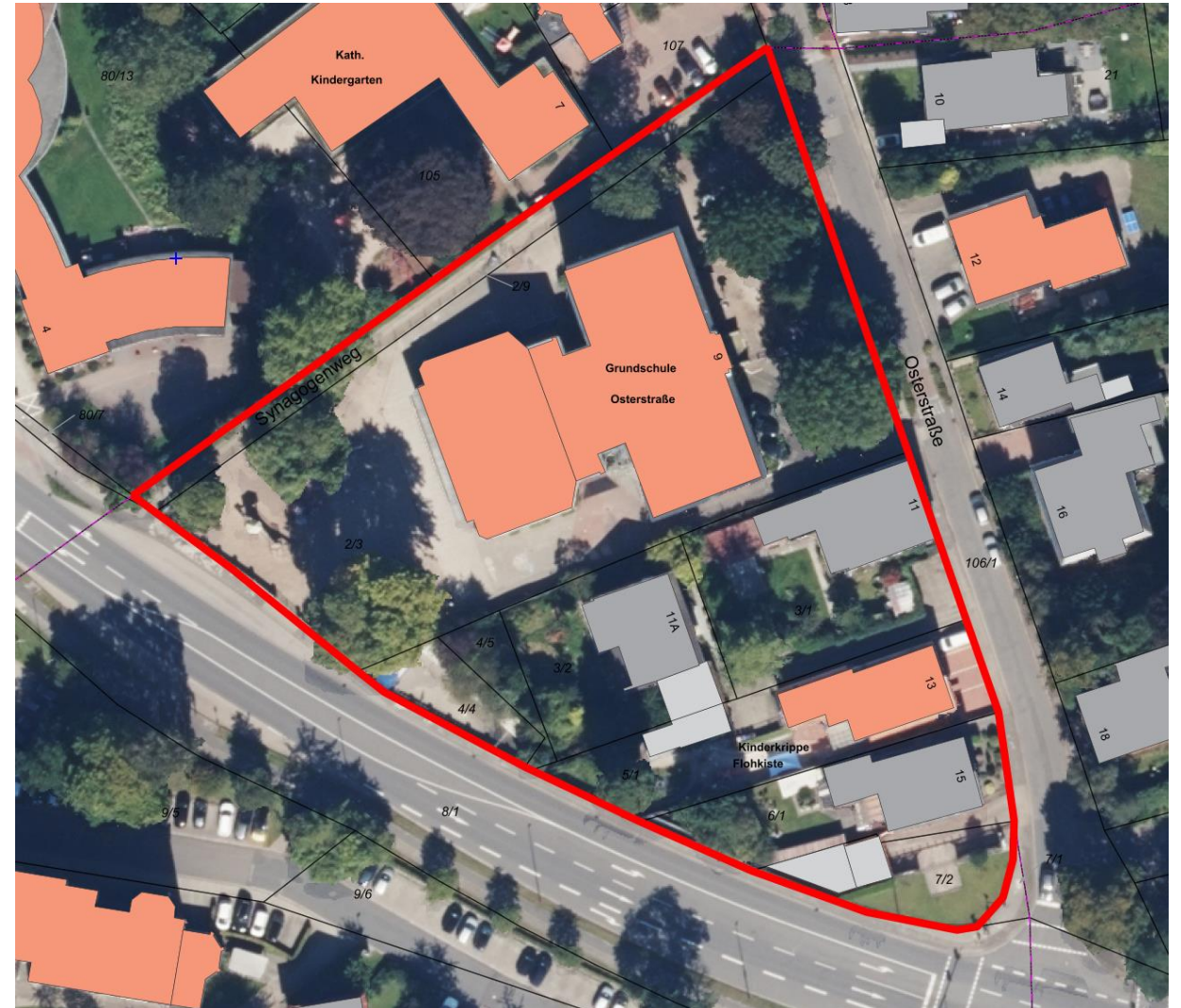
Geltungsbereich BP Nr. 70, 2. Änderung

Im Zuge der Bebauungsplanänderung sollen außerdem die verbleiben Grundstücke des allgemeinen Wohngebiets überplant werden um den Bebauungsplan an die städtebaulichen Entwicklungen der letzten 40 Jahre anzupassen. Die angesprochenen Grundstücke sollen aber ihre Festsetzung als allgemeines Wohngebiet behalten.