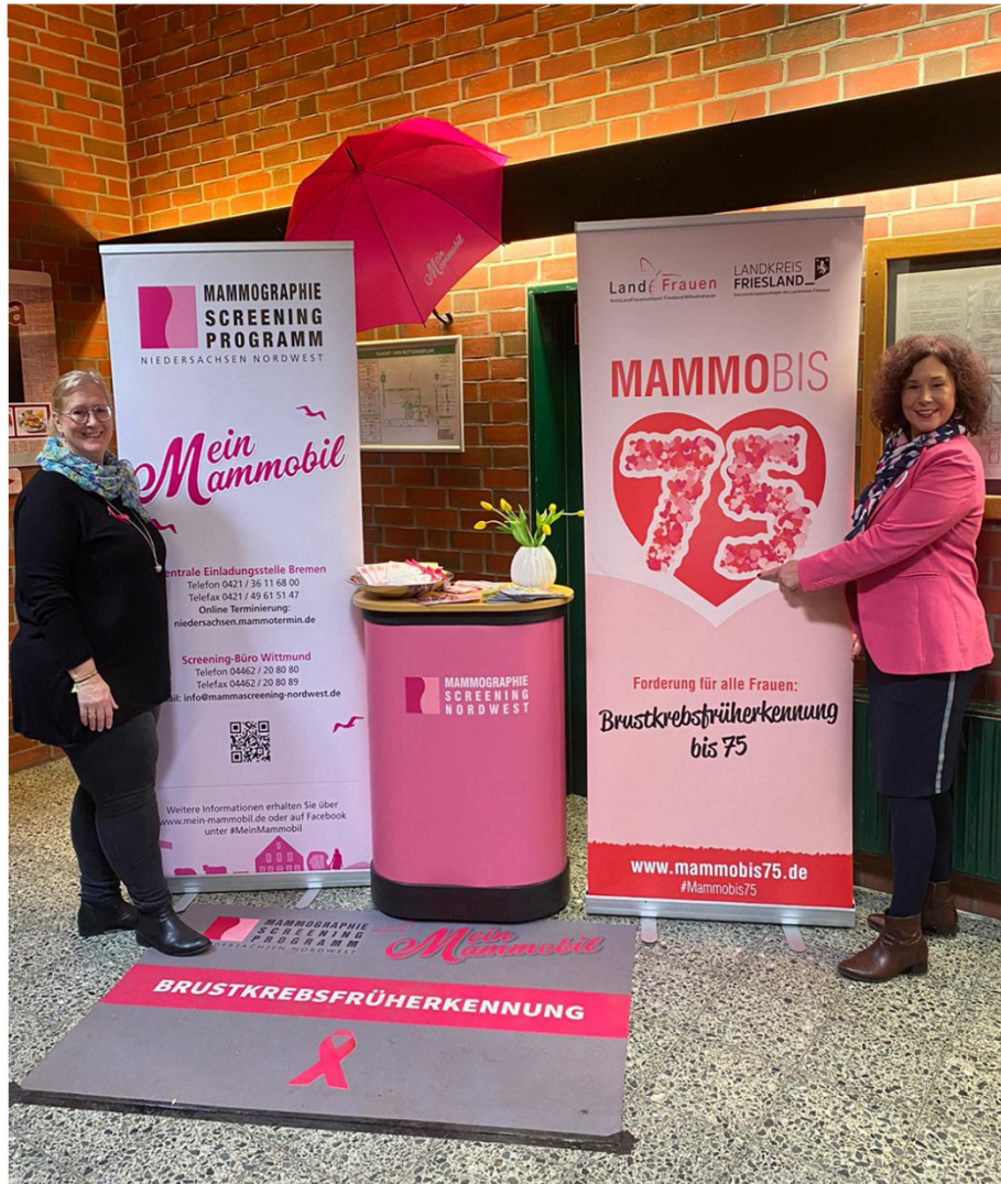
Infostand Mammomobil Frauenflohmarkt